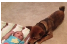
ไม่ให้คลาดสายตา ภาพ