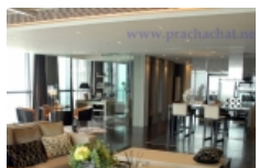
พชมวิถีไฮโซ The Pano