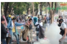
รวมภาพเหตุการณ์ปะทะกันระ