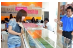
คู่มือซื้อปคอนโตฯ LPN